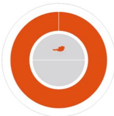
Herkunft der Nachweise

75,16 % Wasserkraft 22,06 % Sonnenenergie 2,78 % Sonstige erneuerbare Energieträger